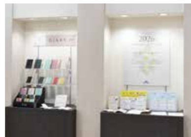
東京本社ダイアリー受注会

海外ではホビー・クラフト・DIY用品に特化した国際見本市creativeworld(ドイツ)やNYのライフスタイル見本市(アメリカ)などに共同出展。さらに毎年社内展示会「ダイアリー受注会」「春の新製品フェア」「秋の新製品フェア」などを年数回開催しています。