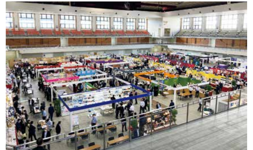
オータムフェア 福岡国際センター

年3回の展示会開催 春/グランドフェア 夏/シーズン&ファンシーフェア (手帳・カレンダーフェア) 秋/オータムフェア