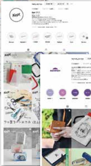
raymay_bungu (インスタグラム アカウト)