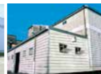
宮崎中央倉庫(宮崎)