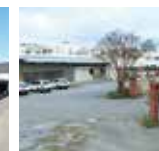
沖縄物流センター