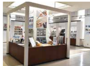
春・秋の新製品フェア