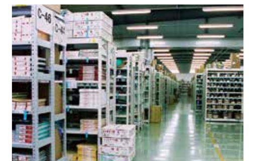
豊富な在庫:筑後物流センター内

沖縄物流センター 沖縄・先島エリアに専門特化した、OS・RSの物流を担うセンターです。定番在庫11,500SKUを管理しています。