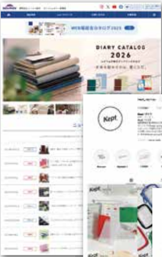
kept_raymay (インスタグラム アカウト)

https://www.raymay.co.jp/bungu/ (ステイショナリー事業部 ホームページ)