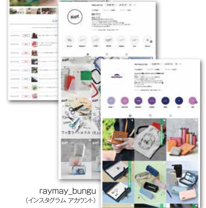
raymay_bungu (インスタグラム アカウント)