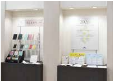
東京本社ダイアリー受注会

海外ではホビー・クラフト・DIY用品に特化した国際見本市creativeworld(ドイツ)やNYのライフスタイル見本市(アメリカ)などに共同出展。さらに毎年社内展示会「ダイアリー受注会」「春の新製品フェア」「秋の新製品フェア」などを年数回開催しています。