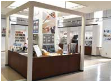
春・秋の新製品フェア