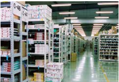
豊富な在庫:筑後物流センター内

沖縄物流センター 沖縄・先島エリアに専門特化した、OS・RSの物流を担うセンターです。定番在庫11,500SKUを管理しています。