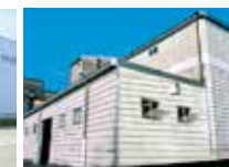
宮崎中央倉庫 (宮崎)